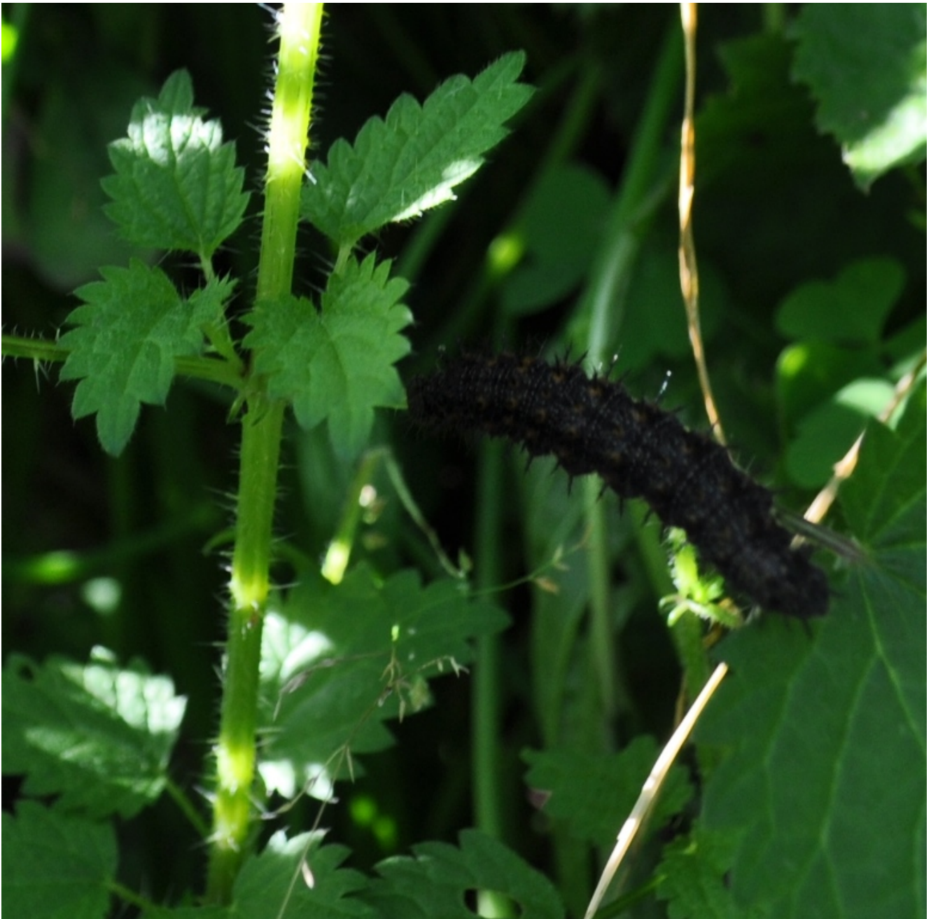
Raupe des Tagpfauenauges

Auch haben sich nun Raupen des Tagepfauenauges bei uns auf den Brennnesseln niedergelassen.