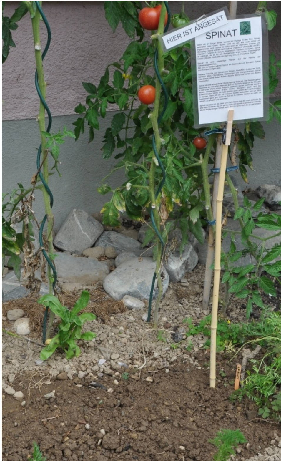
Spinat angesät im Spätsommer.

Spinat benütze ich als Salat und mein Mann mag ihn auch gekocht. Es gibt viele Rezepte, die ich gerne noch mit Spinat ausprobieren möchte. Meine Kinder mögen Spinat auch. Nur ich lerne noch ihn zu geniessen!