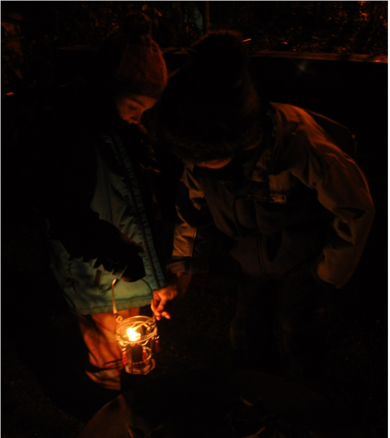
Mein Sohn nimmt das Licht unserer Ahnenkerze.