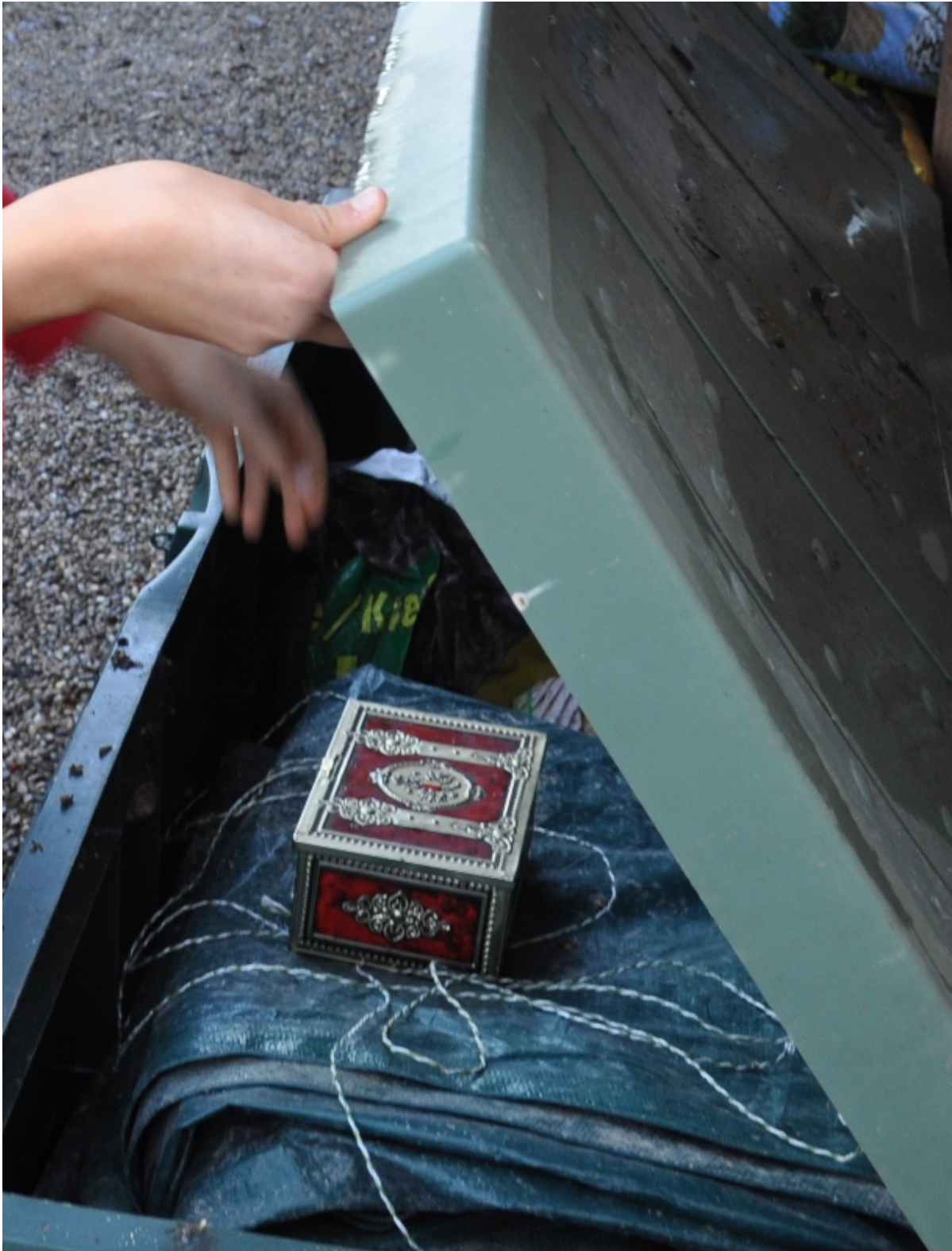
Der Wintersonnwendtschatz befindet sich draussen.